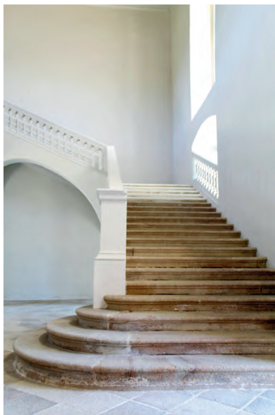
Le Château de la Seilleraye à Carquefou