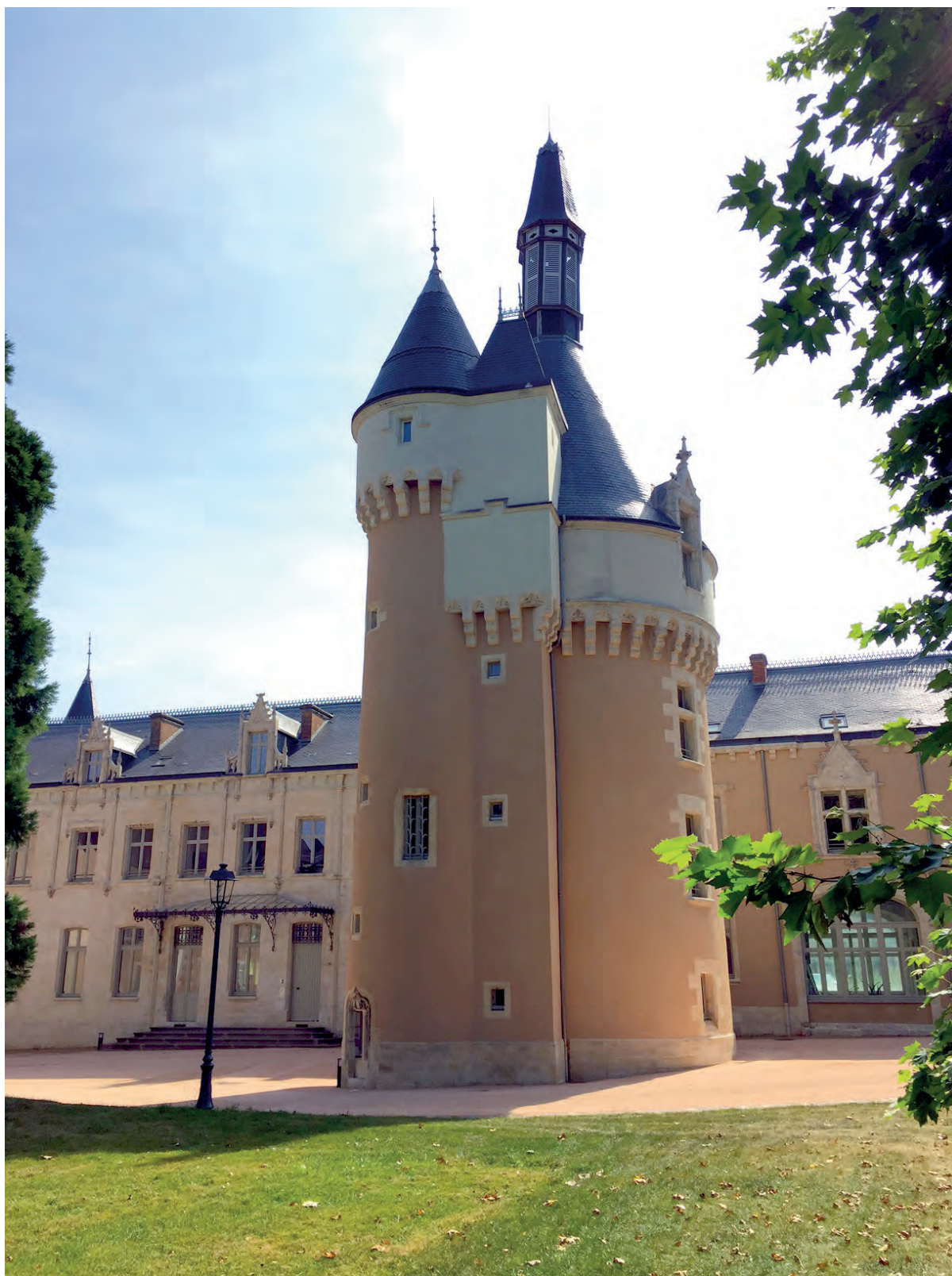
Château Tour à Châteauroux