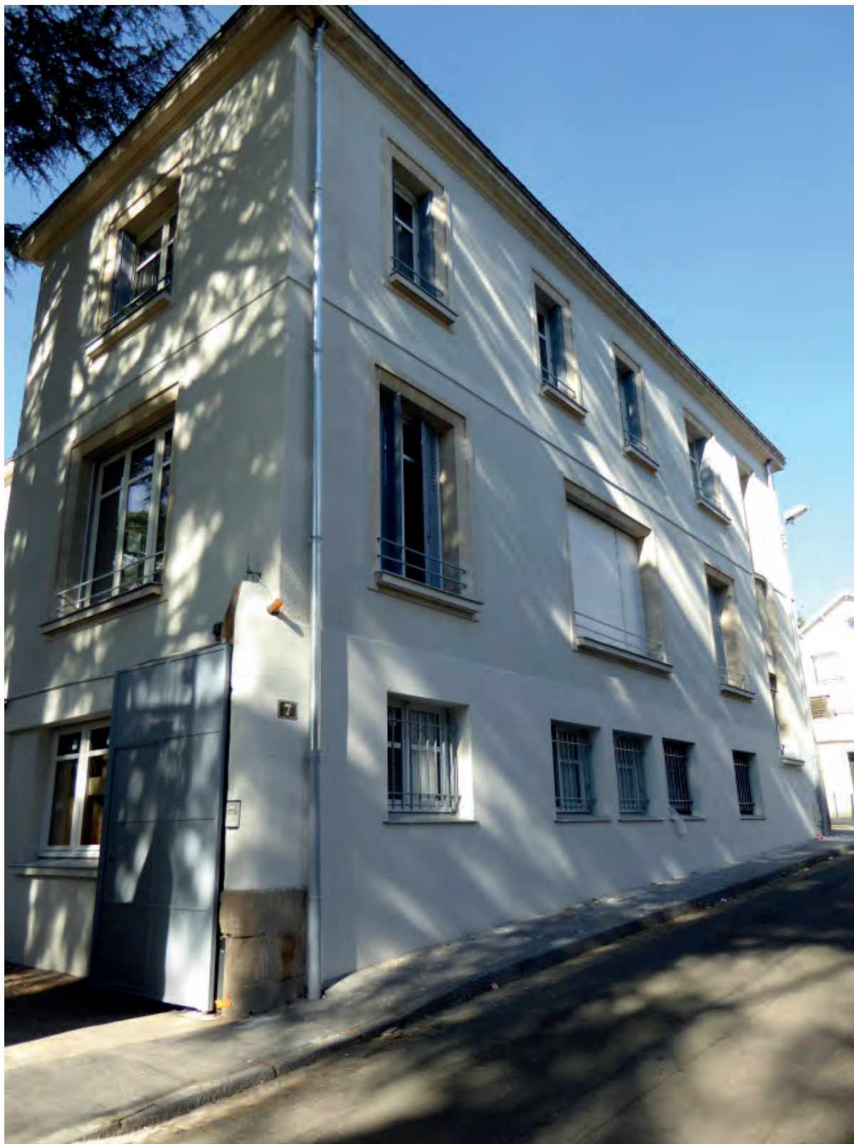
Maison Rousseau, boulevard Saint-Aignan/boulevard Lémot à Nantes Achèvement des travaux décembre 2017