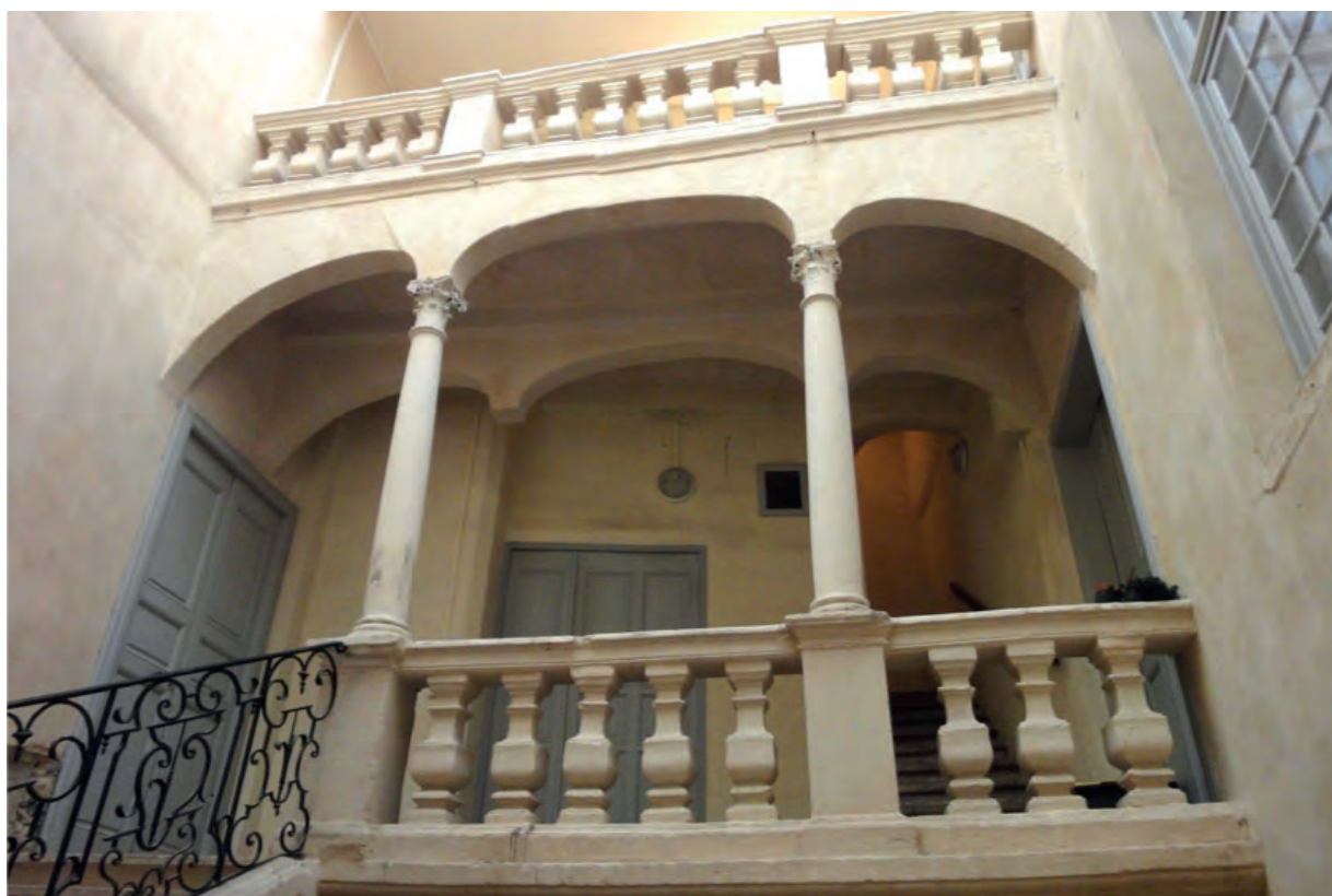
L'Hôtel des Oliviers à Sommières (Gard) Des parties communes exceptionnelles