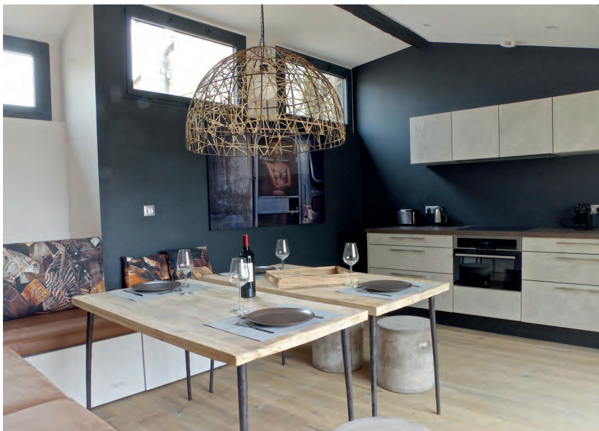
5 quai des Chartrons à Bordeaux Achèvement des travaux avril 2017