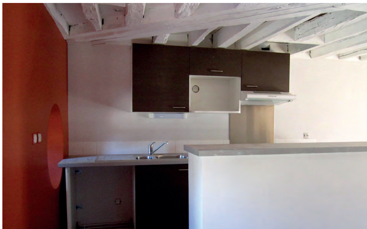
Dépendances du Château de Morigny-Champigny Réception octobre 2013